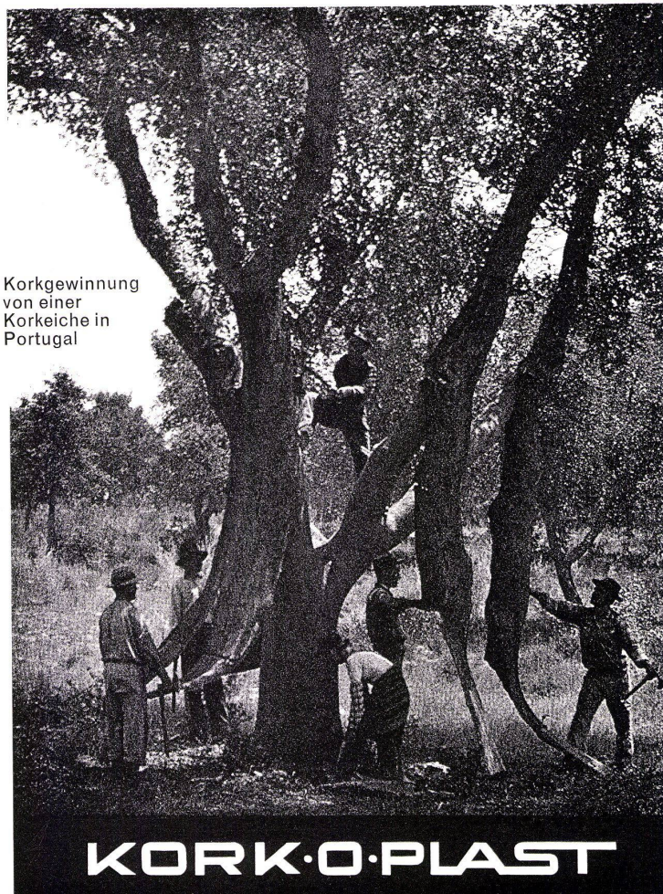
Korkgewinnung von einer Korkeiche in Portugal

9009 ST. GALLEN Lukasstrasse 30 071 / 24 68 65 8040 ZÜRICH Badenerstrasse 329 051 / 54 86 86 1700 FRIBOURG 3, avenue Beauregard 037 / 2 48 06 7002 CHUR Gäuggelistrasse 4 081 / 22 06 45 6000 LUZERN Unt. Dattenbergstr. 8 [041 / 41 10 86