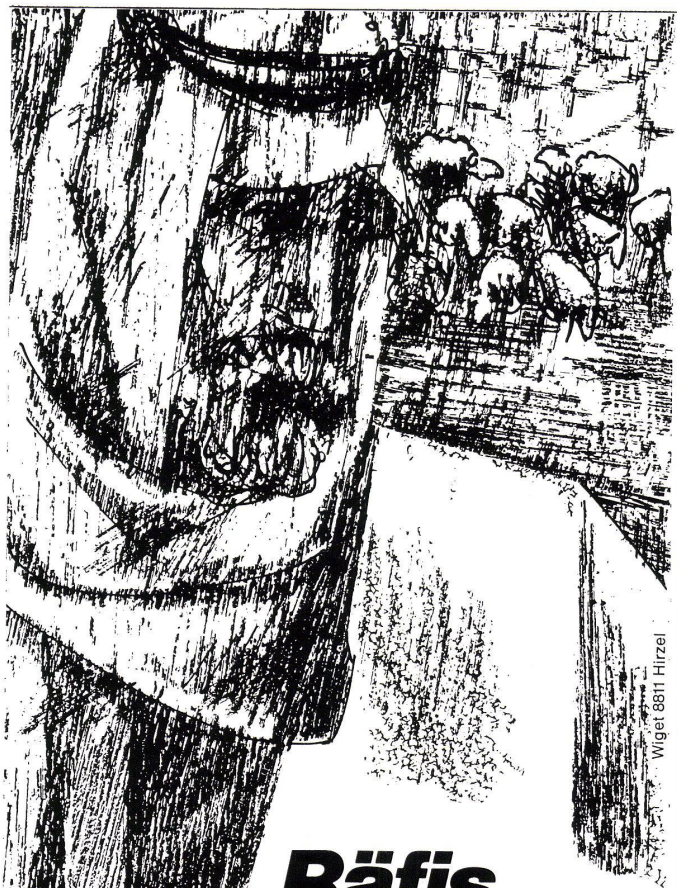
Wiget 8811 Hirtzel