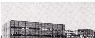
B. + F. Haller, Architekten BSA

U. Schärer Söhne AG-USM Stahlbau-System «Haller» 3110 Münsingen 031 92 14 37