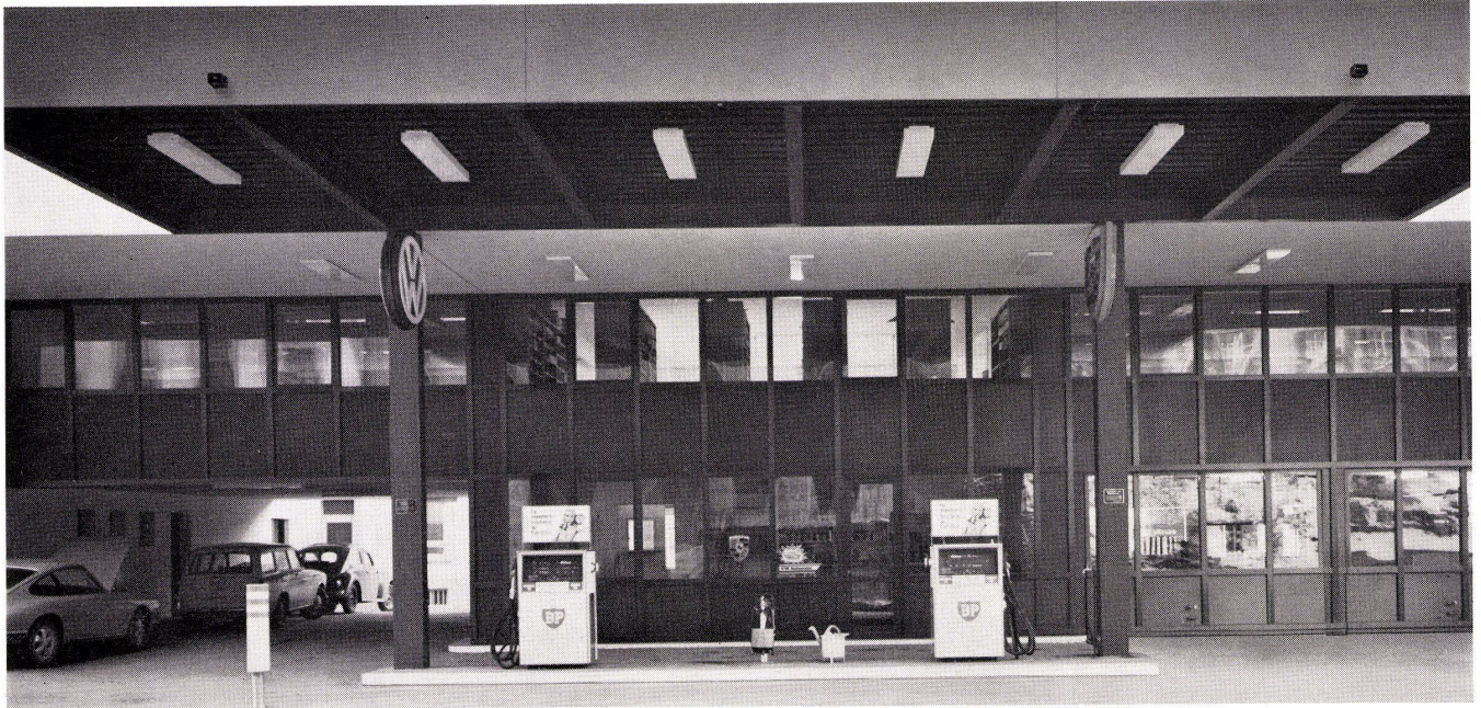
Vordachkonstruktionen und Metallfassaden

Metallbauarbeiten an einer Tankstelle. Projektierung und Ausführung der selbsttragenden Vordachkonstruktion, der Metallfassade und der Eingangspartien in broncefarbenem Leichtmetall.