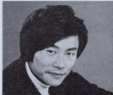
Kisho N. Kurokawa

Geboren 1934 in Nagoya. Studium an der Kyoto University 1957 und Tokyo University 1964. Mitarbeit bei Kenzo Tange 1958 bis 1965. Seit 1962 Präsident der Kisho N. Kurokawa Arch.+Ass., 1967 Präsident des Urban Design Consultant, 1970 Direktor des Instituts Social Engineering. Eigenes Büro seit 1962. Mitglied der Japan Architects Association, Architectural Institute of Japan, Japan Society of Futurology. Auszeichnungen: 1969 Erster Preis des Pilot Low Cost Housing in Peru, 1971 Borbourg Center in Paris. 1972 Erster Preis New Tanu National Headquarters usw. Wichtige Bauten: Neue Stadt Hishino, 1968, Neue Stadt Fujisawa, 1970, Nakagin Geschäftskapsel, 1972, usw. Lesehalle, Chiba University, 1964, usw.