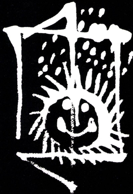
C. Plattl / H. J. Bolzhauser

Das SP Fenster ist dadurch die Antwort auf die Frage nach dem guten und preiswerten Fenster.