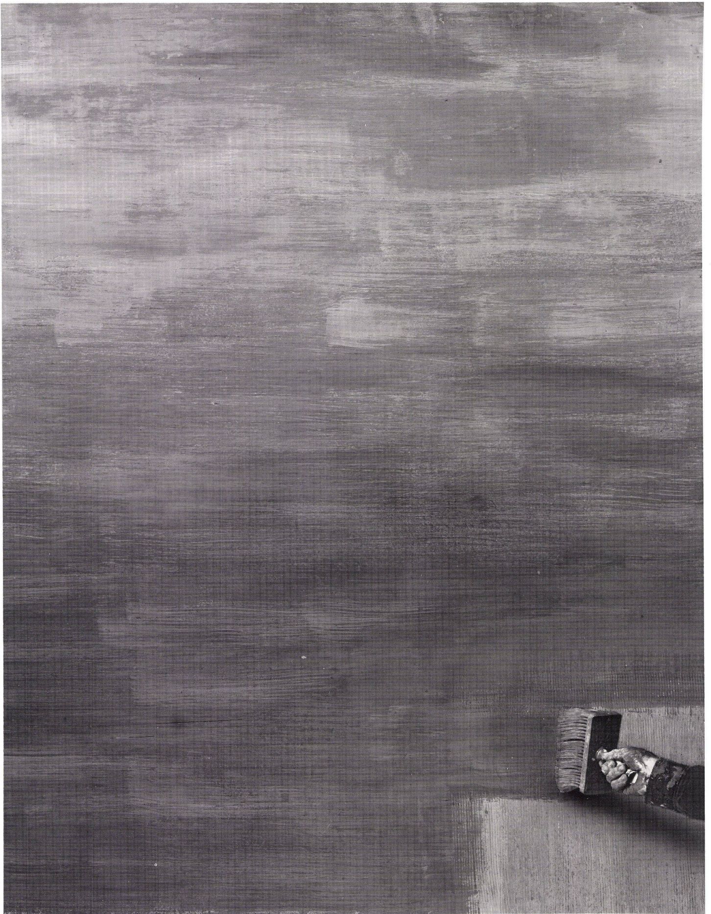
Das ist eine Mauer aus Beton. Dahinter ist Wasser, das drückt und drückt. Vergebens. Denn hier wurde dauerhaft abgedichtet. Mit Barra-Schlammputz, einem Produkt von Meynadier.