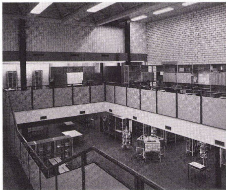
1 Hauptgebäude Eingang C. Bâtiment principal entrée C. Main building, entrance C.