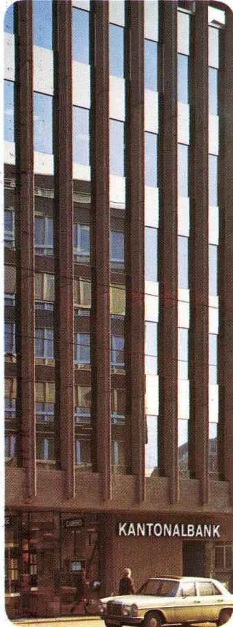
Kantonbank und Schweizer Bankverein Basel – Schweiz, 1972 INFRASTOP-Auresin 39/28 kombiniert mit PHONSTOP Burckhardt + Partner Architekten, Basel