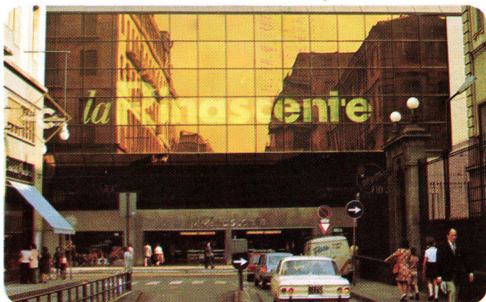
La Rinascente Torino – Italien, 1973 SIGLA-INFRASTOP-Gold 50/33 – Arch. Albertini e Bodega, Torino