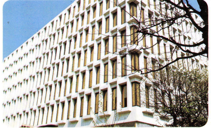
Publicitas S.A. Lausanne – Schweiz, 1974 INFRASTOP-Bronze 36/26 – Architekt P. Prod'hom, Lausanne