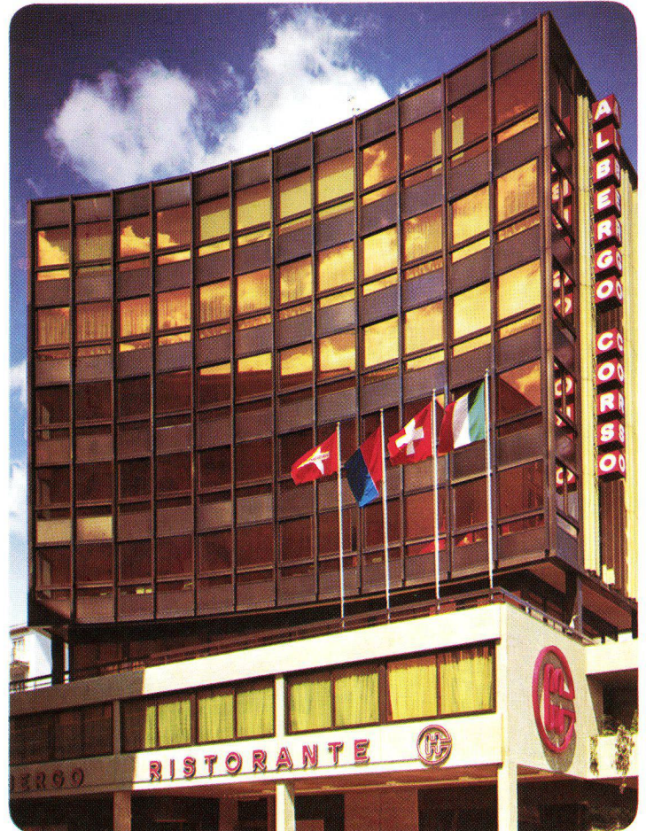
Immobile Commerciale Al Corso S.A. Chiasso – Schweiz, 1973 INFRASTOP-Gold 40/26 – Studio Grassi + Co., Chiasso