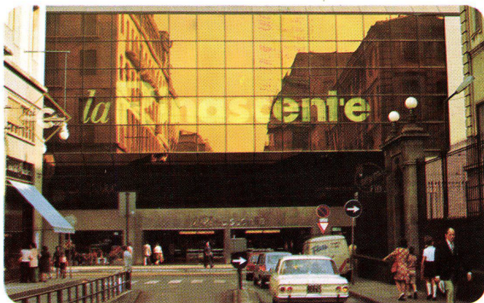
La Rinascente Torino – Italien, 1973 SIGLA-INFRASTOP-Gold 50/33 – Arch. Albertini e Bodega, Torino