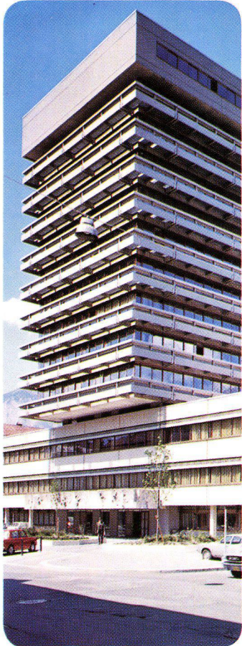
Landes- und Bezirksgericht Innsbruck Österreich, 1972 INFRASTOP-Auresin 66/44 Dipl. Ing. K. Pfeiler, Innsbruck

INFRASTOP-Sonnenschutzgläser schaffen raffinierte Fassadenästhetik und individuelles Raumklima.