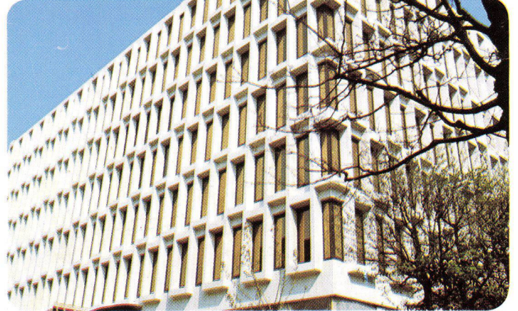
Publicitas S. A. Lausanne – Schweiz, 1974 INFRASTOP-Bronze 36/26 – Architekt P. Prod'hom, Lausanne