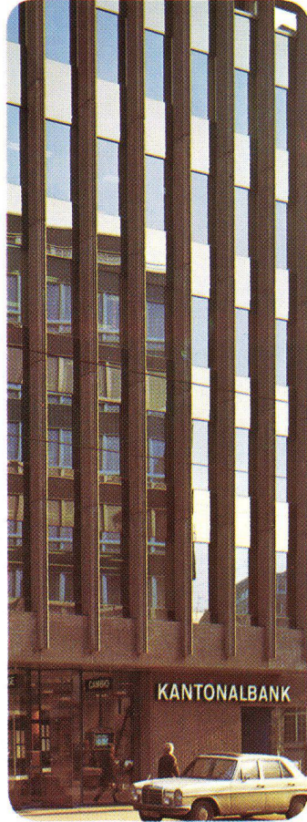
Kantonbank und Schweizer Bankverein Basel – Schweiz, 1972 INFRASTOP-Auresin 39/28 kombiniert mit PHONSTOP Burckhardt + Partner Architekten, Basel