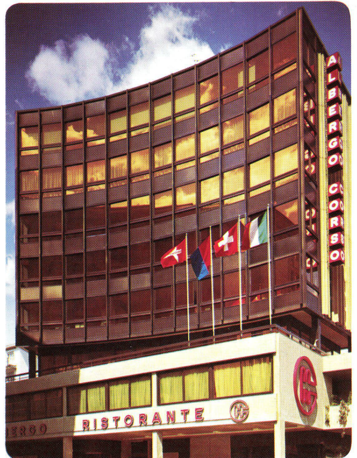
Immobile Commerciale Al Corso S. A. Chiasso – Schweiz, 1973 INFRASTOP-Gold 40/26 – Studio Grassi + Co., Chiasso