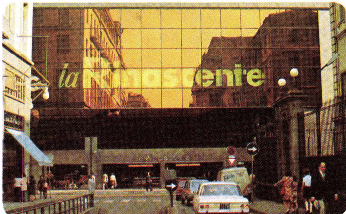
La Rinascente Torino – Italien, 1973 SIGLA-INFRASTOP-Gold 50/33 – Arch. Albertini e Bodega, Torino