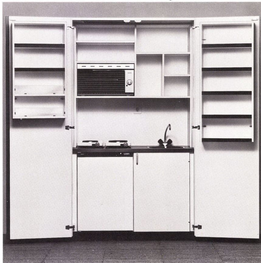
Gesamtansicht der Kleinküche mit geöffneten Türen. Masse: geöffnet 248,5×230×72 cm geschlossen 124,5×230×72 cm