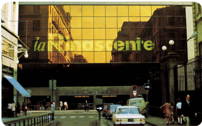
La Rinascente Torino, Italien, 1973 SIGLA-INFRASTOP-Gold 50/33 – Arch. Bordogna, Torino