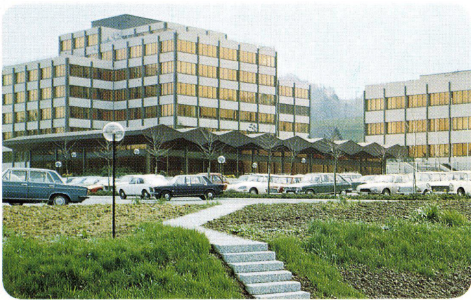
Dow-Center Horgen, Schweiz, 1973 INFRASTOP-Gold 40/26 T – Arch. R. Leuzinger, Pfäffikon SZ

Bedingungen. Mit INFRASTOP-Sonnenschutzgläsern gestaltet der Architekt raffinierte Fassadenästhetik und individuelles Raumklima.