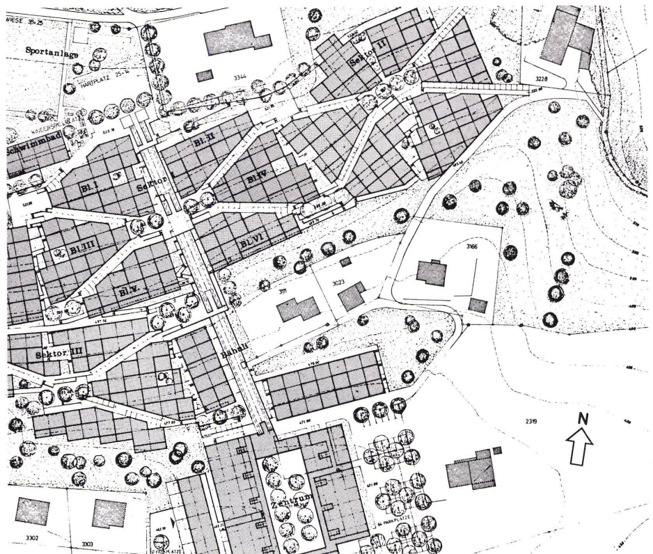
6 Diagonale Wege als Kommunikationsbereiche. Chemins diagonaux servant de zone de communication. Diagonal pathways serving as access routes.

Mit dem Projekt Oftringen ist es also gelungen, die Prämissen, die wir uns zu Anfang der Arbeit gestellt hatten, zu erfüllen. Gleichzeitig konnte der bekannte Widerspruch zwischen dem Bedürfnis nach Differenzierung und dem ökonomischen Zwang der Wiederholung abgeschwächt werden, und zwar nicht durch künstliche Variationen der Formen, sondern einmal durch die Kombination von Diagonalschließung und orthogonalem Raster und zum andern durch die Variationsmöglichkeiten innerhalb des Rasters, wobei gleiche Elemente wiederholt, aber verschiedenartig kombiniert werden.