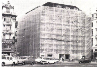
1 Monarflex-Gerüstplane mit Befestigungsösen und Patentbefestigungsglasche für Gerüstmontage.