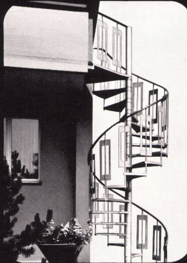
Nottreppe am neuen Fingerdock in Kloten