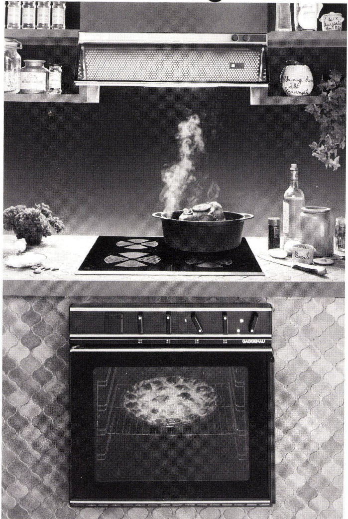
Zum Beispiel: die Glaskeramik-Kochfläche mit Einbauherd und Dampfzug