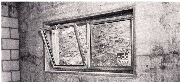
Eingebautes ACO Sessa Fenster, 120 x 60 cm

Fertigelemente tragen zur rationelleren Bauweise bei.