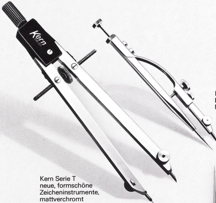
Kern Serie T neue, formschöne Zeicheninstrumente, mattverchromt