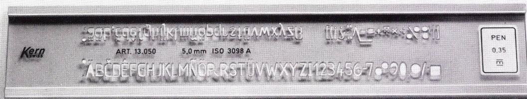
Kern Schriftschablonen für die gebräuchlichen Normschriften