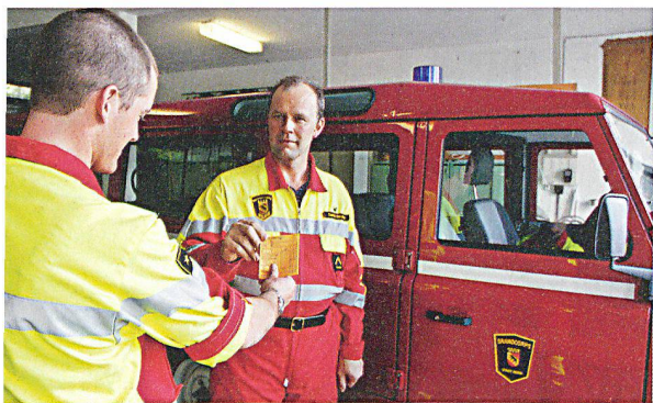
Ob per Soldsäckli oder via Banküberweisung – der Schweizerische Feuerwehrverband SFV fordert, dass jeglicher besoldete Feuerwehrdienst von der Steuer befreit wird.

Wer als Feuerwehrfrau oder -mann bereit ist, für die Allgemeinheit rund um die Uhr, 365 Tage im Jahr auszurücken, zu helfen und die Risiken eines Einsatzes zu tragen, soll nicht durch Steuern bestraft werden: Der Schweizerische Feuerwehrverband SFV fordert, dass jeglicher besoldete Feuerwehrdienst von der Steuer befreit wird. Für Funktions- und Amtsentschädigungen verlangt der SFV einen Freibetrag von 5000 Franken.