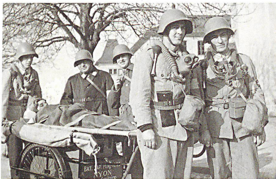
Das neue Buch zeigt die Geschichte des Zivilschutzes seit seinen Anfängen. Im Bild: Sanitätsdienst.

Sechs Jahrzehnte Zivilschutz am Beispiel des Kantons Waadt beschreibt das neue Buch «La protection civile vaudoise» von Marc Dumartheray. Der Zivilschutz ist in seiner Geschichte immer eine Organisation zum Schutz und zur Sicherheit aller gewesen, hat sich aber an die jeweiligen Anforderungen anzupassen gewusst: Das reich illustrierte Buch zeigt, wie sich die Organisation vom Luftschutz im Zweiten Weltkrieg über den Zivilschutz des Kalten Kriegs hin zur Partnerorganisation im Verbundsystem Bevölkerungsschutz entwickelt hat. «Heute führt der Zivilschutz die Bevölkerung nicht mehr hinab in die Schutzräume, um sie bei einer Bombardierung oder gar einem nuklearen Holocaust zu schützen. Vielmehr kommt er aus dem Untergrund hervor, um den Opfern von Katastrophen zu helfen», erklärt der Autor.