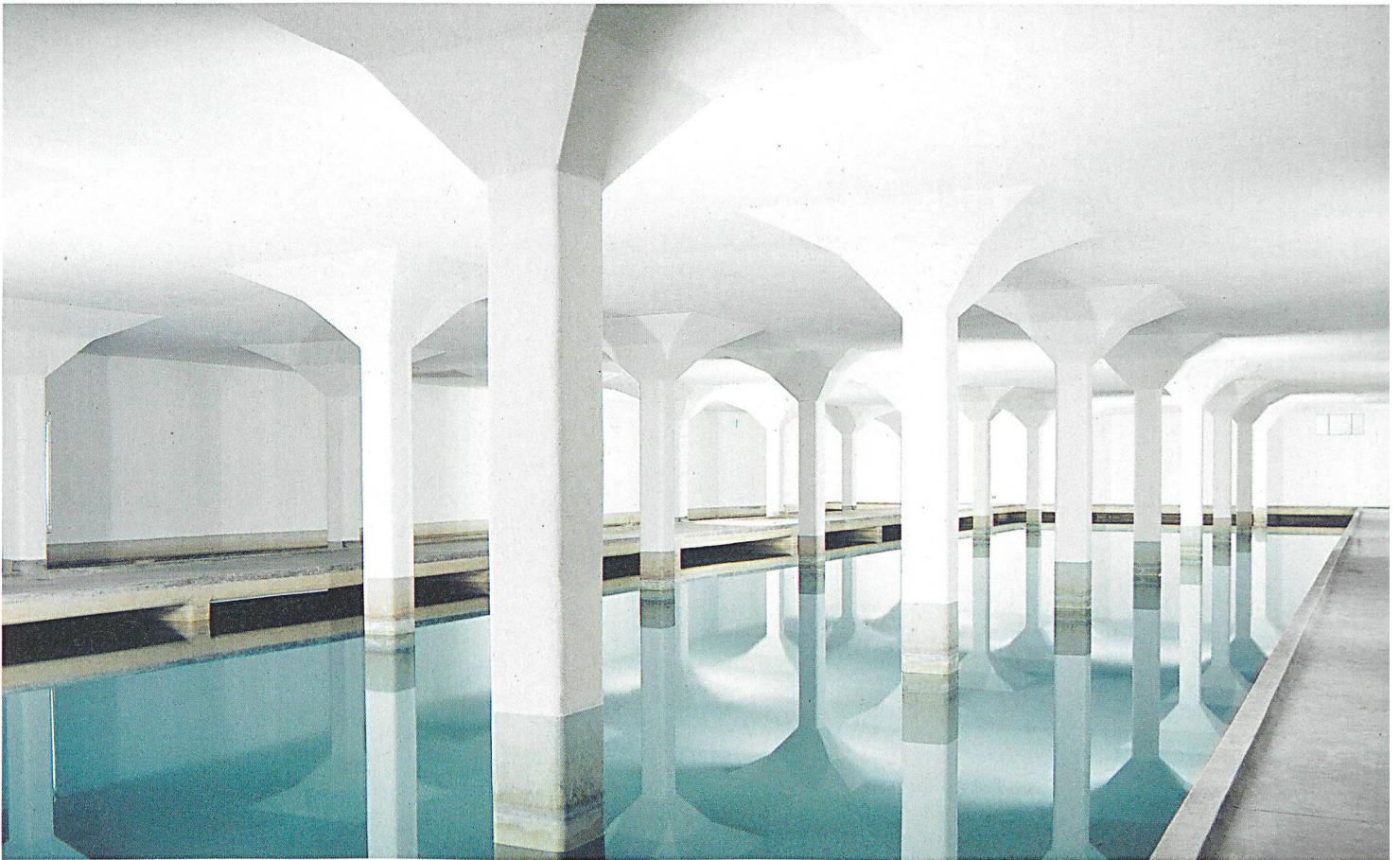
In der Seewasseraufbereitungsanlage Lengg sickert das Wasser durch die horizontal eingelegte Sandschicht.

Grundsätzliche Vorsicht gegenüber qualitativen Störungen ist gleichwohl geboten. Die Trinkwasserversorgung ist – trotz unterirdischer Wasserspeicher und Leitungsrohre – ein offenes System. «Hausanschlüsse oder Hydranten bieten leichten Zugang», so Rieder. Eingehende Sicherheitsabklärungen und Berechnungen hätten aber gezeigt, dass sich mögliche Verschmutzungen nur langsam ausbreiten, was eine ausreichende Reaktionszeit erlaubt.