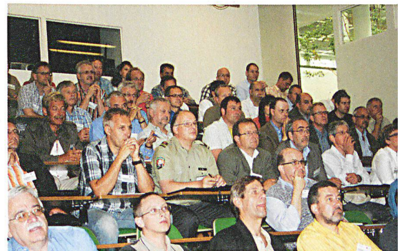
Die Zivilschutzkader hören genau hin: Die Arbeitssicherheit und der Schutz der Zivilschutzangehörigen gehören zur Führungsverantwortung.