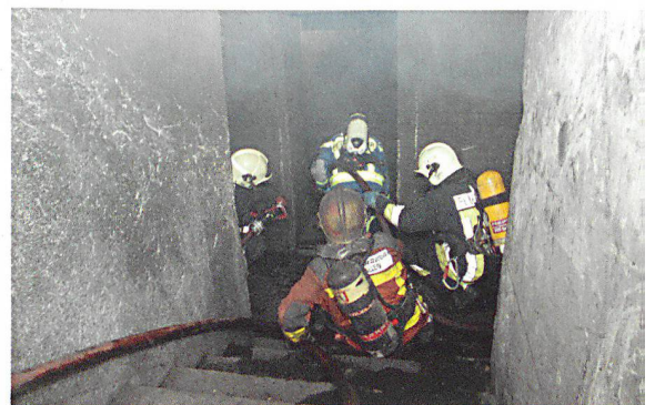
Szene aus dem Atemschutz-Einsatz-Training des SFV – praxisnahe Ausbildung am Feuer.