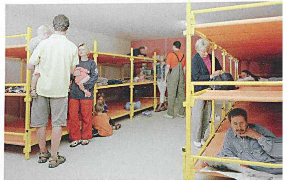
«Die Beispiele Deutschland, England und Japan im Zweiten Weltkrieg zeigen, dass die Menschen nicht mit Panik und Selbstaufgabe reagieren, sondern immer Schutz suchen.»

Chef Planung und Steuerung Infrastruktur, BABS