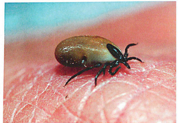
An etwa 160 Standorten wurden 2009 insgesamt mehr als 62 000 Zecken gesammelt und anschliessend auf FSME hin untersucht.