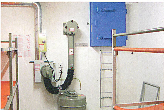
Die Schutzraumbaupflicht soll bestehen bleiben, geplant ist aber eine markante finanzielle Entlastung.