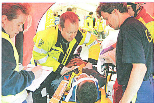
Nach dem (angenommenen) Turnhalleneinsturz war die Rettungskette gefordert.

Zwei Klassen der Oberstufe proben für eine Theaterauf-führung in der Turnhalle einer Schule in Estavayer-le-Lac. Plötzlich stürzt ein Teil des Turnhallendachs auf die Schü-