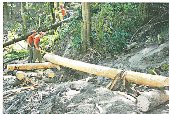
1,6 Kilometer Weg und acht Brücken mussten die Einsatzkräfte erstellen.

Um alle Aktivitäten leiten zu können, richtete der Zivilschutz einen Kommandoposten, eine Transportzentrale, einen Verpflegungsposten, eine Betreuungsstelle sowie ein Materialdepot ein.