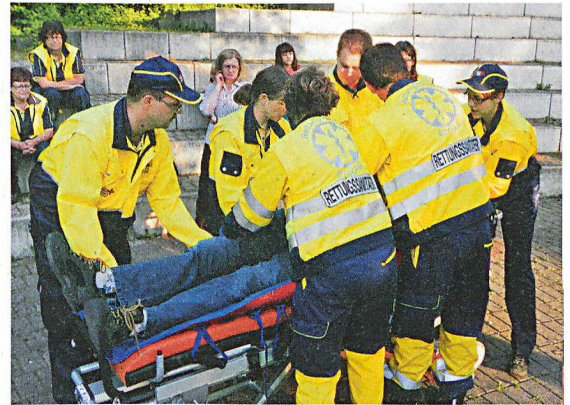
Die Zusammenarbeit mit dem Rettungsdienst ist das Thema der diesjährigen Weiterbildung der Ausbildungskader der Samaritervereine. Das Bild entstand an der Weiterbildungstagung der Thurgauer Samariter.