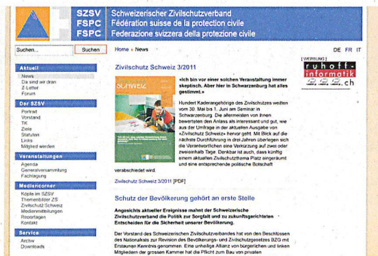
Eine zentrale Rolle in der Kommunikation spielt auch beim SZSV die Website.

Weiterführende Link: www.zivilschutz-schweiz.ch