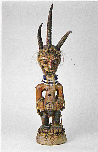
Die Ngil-Maske (links) war ein Symbol des Schreckens und der Rache, ihr Träger konnte Zauberer verwirren und Verbrecher bestrafen. Die Songye-Figur (rechts) diente vermutlich primär der Abwehr von Schadzauber und der Förderung der Fruchtbarkeit.