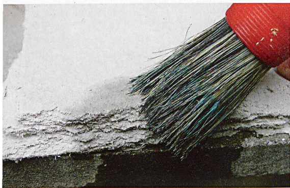
Bei der Probeentnahme soll bei weichem oder sprödem Material die Staubbildung durch Befeuchten mit Wasser verhindert werden.

Weitere Informationen: Eine Hilfe bietet die SUVA-Broschüre «Asbest erkennen – richtig handeln» unter der Rubrik «Ermittlungspflicht vor Beginn von Bauarbeiten», www.suva.ch/asbest