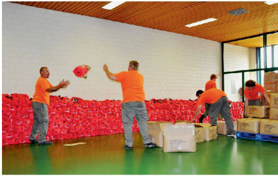
Der Solothurner Zivilschutz bereitet unzählige Zelte für die Abgabe vor.

6000 Gigathletinnen und Gigathleten massen sich letzten Sommer für drei Tage in fünf Disziplinen. Auf der Helferseite leisteten 270 Zivilschutzleistende 1000 Dienstage zu Gunsten dieses einzigartigen Sportabenteuers. Es war der bisher grösste Zivilschutzeinsatz im Kanton Solothurn.