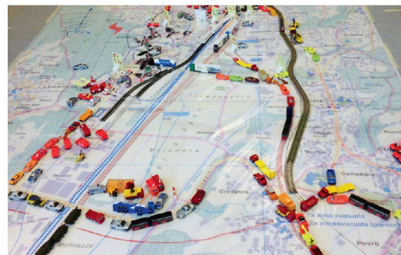
Die Übungsregie setzte ein Modell ein, um die Ereignisse nachzubilden.

Neben den operativen Bereichen der Partnerorganisationen war es insbesondere möglich, die Krisenkommunikationszelle zu testen. Ein Abschlussbericht mit den gesammelten Daten und Erfahrungen wird den beteiligten Partnern bei Optimierungen helfen.