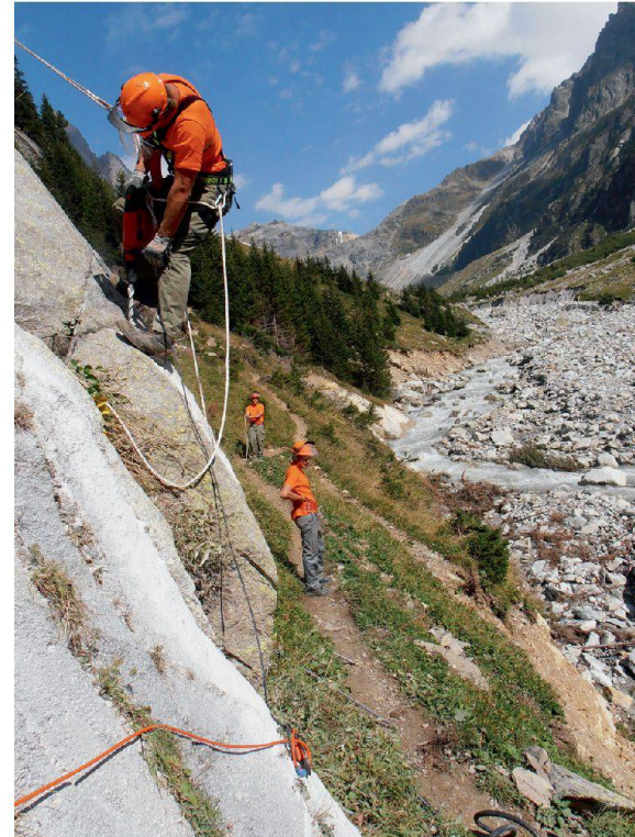
Nach dem Hochwasserereignis Kander 2011 stand die ZSO Gantrisch im September 2012 im Gasterntal für Instandstellungsarbeiten im Einsatz. Auch schnelle Einsätze sollen im Kanton Bern künftig besser planbar sein.

Drei Personen der AZB stehen für koordinierende Tätigkeiten in Bereitschaft: Der Führungskoordinator 1 koordiniert den Einsatz der weiteren Mittel des Zivilschutzes. Der Führungskoordinator 2 übernimmt die Koordination logistischer Aufgaben wie die Fahrzeugbestellung bei der Logistikkbasis der Armee, die Reservation von Unterkünften, die Organisation von Verpflegung und/oder notwendigem Zusatzmaterial. Der Führungskoordinator 3 unterstützt, wenn nötig, das zivile regionale Führungsorgan. Zusätzlich stehen neben dem Personal der AZB weitere Führungskoordinatoren Front zur Verfügung (rekrutiert aus den Partnerorganisationen des Bevölkerungsschutzes).