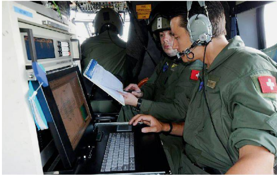
Bereits während des Messflugs mit dem Aeroradiometrie-Helikopter kann der Operator die Ergebnisse der Messung sehen.

An der Übung RadEx 14 ging es um die Zusammenarbeit zwischen den kantonalen Einsatzkräften und den Einsatzorganen des Bundes. Geübt wurde der Einsatz nach einer Freisetzung radioaktiver Substanzen.