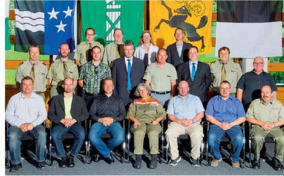
Die frisch diplomierten und zertifizierten Zivilschutzinstructorinnen und -instructoren.