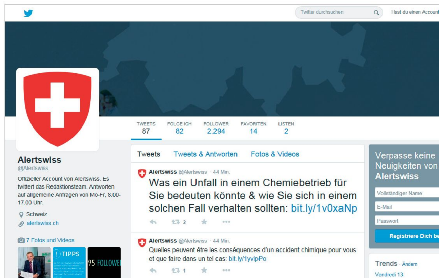
Offizieller Twitteraccount von Alertswiss: Wer @alertswiss folgt, erfährt News aus dem Bevölkerungsschutz und über Alertswiss-Aktivitäten.