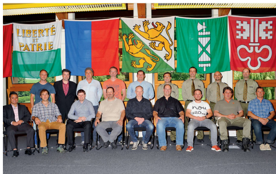
Die Diplomierten im Eidgenössischen Ausbildungszentrum in Schwarzenburg (EAZS).

Der Zivilschutz verfügt über neues Lehrpersonal: Das BABS hat am 26. Juni 2015 in Schwarzenburg fünfzehn haupt- und vier nebenamtlichen Zivilschutzinstructoren ihre verdienten Diplome und Zertifikate verliehen.