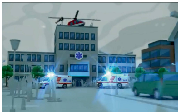
«Sind sie sicher? – Bei Gefahr richtig reagieren»: Der Film zeigt auf, dass jede und jeder mit einfachen Massnahmen die persönliche Sicherheit verbessern kann.

Der vom BABS realisierte Film «Sind sie sicher? – Bei Gefahr richtig reagieren» hat grosse Anerkennung erfahren: Er hat den renommierten europäischen BCP-Award als beste europäische Produktion in der Kategorie Digital Media – Erklärfilm gewonnen.