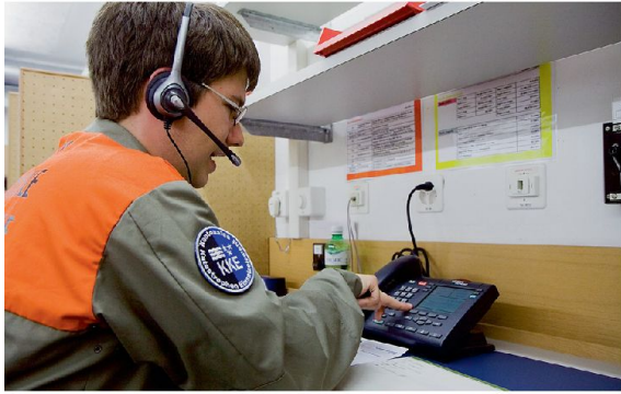
Neben Personal aus der Verwaltung kommen bei der Aargauer InfoLine auch Stabsassistenten aus dem Kantonalen Katastrophen-Einsatzelement zum Einsatz.

Seit einem Jahrzehnt kann der Kanton Aargau bei Katastrophen über eine InfoLine der betroffenen Bevölkerung Information und Unterstützung bieten. Die jüngste Alarmübung hat positive Erkenntnisse gebracht.