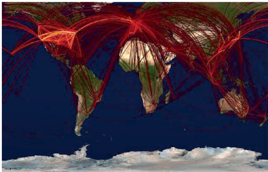
Die Grafik mit den weltweiten Flugbewegungen (normale Flugreisen) gibt ein eindrückliches Bild der heutigen Mobilität. Auf den gelben Linien bewegen sich täglich mehr als 20000, auf den roten Linien 5000 bis 20000 Passagiere.

Die Grafik oben zum Flugverkehr macht die aktuelle globale Vernetzung deutlich und lässt erkennen, dass die Ausbreitung einer Pandemie nicht verhindert werden kann. Auch die Schweiz könnte davon betroffen sein – wir müssen uns deshalb darauf vorbereiten.