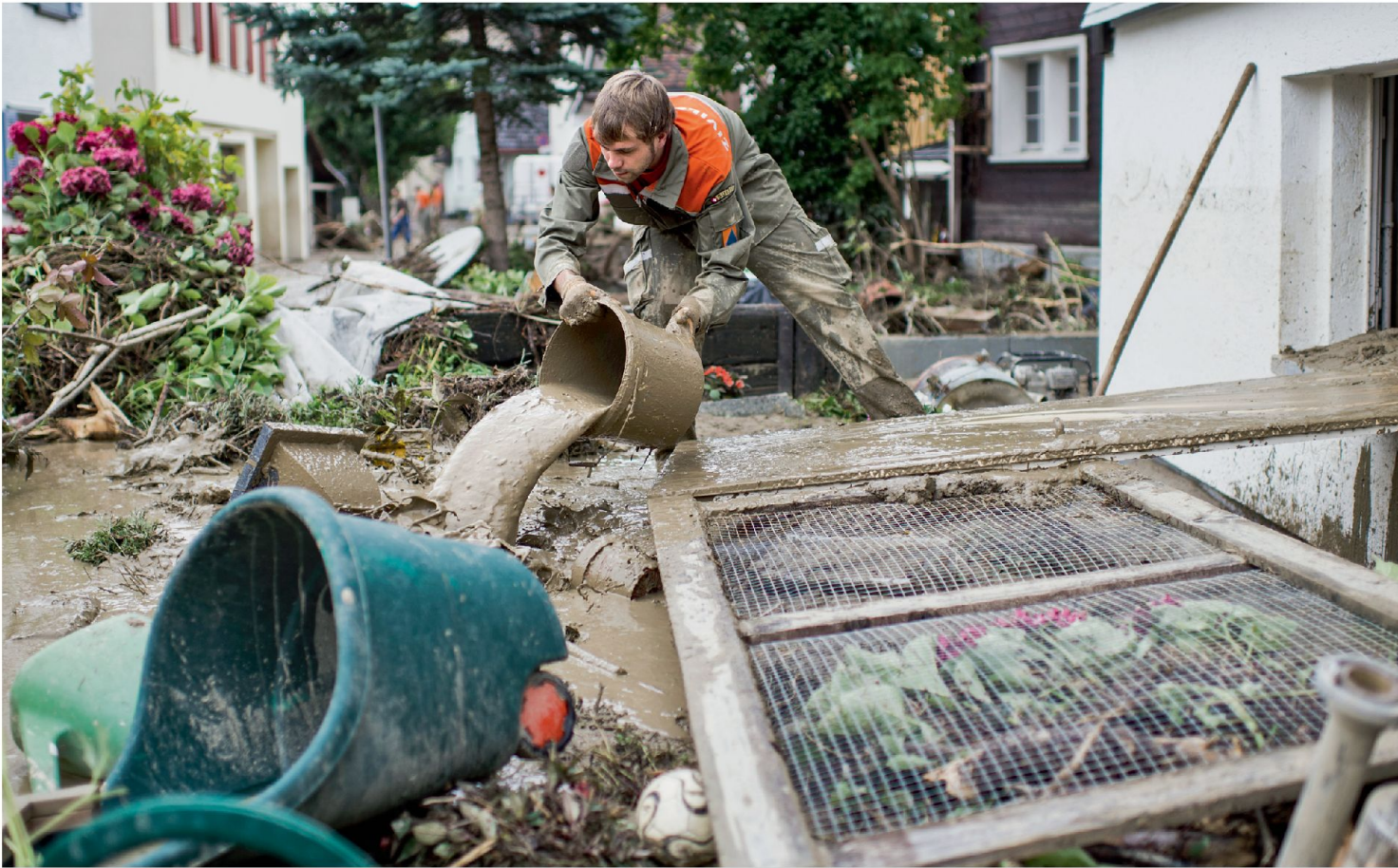
Ereignisse, wie sie in den letzten Jahren immer wieder auftraten, bewältigen lokale und regionale Einsatzkräfte gut. Im Bild: Zivilschutzangehöriger im Einsatz nach Überschwemmungen in Altstätten (SG) Ende Juli 2014.

Einen möglichen grossräumigen und andauernden Ausfall der Stromversorgung zählen nahezu alle Experten heute zu den grössten Risiken. In fiktiver und sehr anschaulicher Weise hat Marc Elsberg in seinem Thriller «Blackout. Morgen ist es zu spät» eindrücklich beschrieben, was einer modernen, stark vernetzten Gesellschaft in diesem Fall blühen könnte. Und weiter: Was ist mit den gesellschaftsbedingten Gefährdungen? Können wir einen Anschlag mit ABC-Substanzen, eine schwere Pandemie oder eine Tierseuche bewältigen? Um diese Fragen zu beantworten, führt das Bundesamt für Bevölkerungsschutz BABS gemeinsam mit zahlreichen Expertinnen und Experten die nationale Risikoanalyse «Katastrophen und Notlagen Schweiz» durch; mit diesem Thema befasst sich auch der aktuelle «Risikobericht 2015». Betrachten wir einige mögliche Risiken etwas genauer.