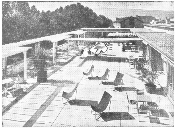
Der Dachgarten des Wohlfahrts Hauses Escher Wyß im Industriequartier in Zürich. Eine vorbildliche Hygiene, die den Architekten Landolt ebenso ehrt wie den Bauherren. Hier gibt's frische Luft in der Arbeitspause.

wachsen nun rasch aus dem Boden dieser bevorzugten Lage. Bis jetzt hatten die Bauunternehmungen gutes Bauklima, so daß die Arbeiten terminmäßig «im Schuß» sind. Wenn diese Reportage im Druck erscheint, ist der Hauptbau im