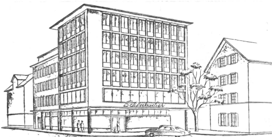
Das neue Schuhhaus Schönbacher, Ecke Langstraße/Dienerstraße, ein moderner Betonbau mit Raster