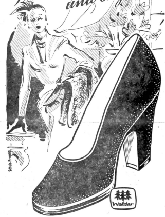
Art. M 5505

Sehr eleganter Pumps in feinem schwarzem Samtcaffleder mit neuer Vernis-Garnitur ab Fr. 47.80