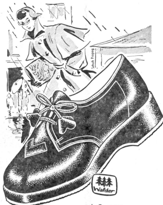
Art. C 6520

Eleganter Campus-Trotteur, Sämischsplit schwarz, mit heller Reptil-Verzierung, Gummisohle . . . ab Fr. 43.80