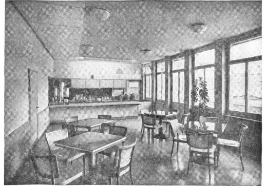
Erfrischungsraum des Personals im erweiterten Telephongebäude