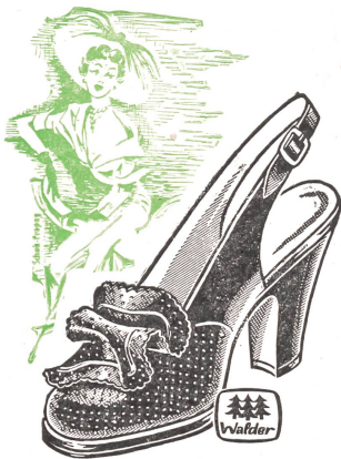
Art. B 6623

Eleganter Slingpump mit neuer Maschenverzierung. Sämischsplit schwarz oder Nubuk weiß . . . . . ab Fr. 34.80