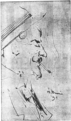
Die Cigarette · Zeichnung v. Max Buri, 1891 Bernser Kunstmuseum