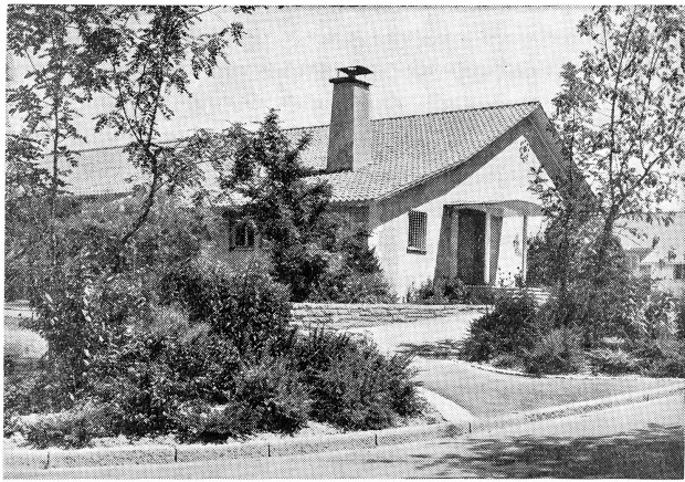
Lebendige Partie aus der besiedelten Grünzone in Zürich 11: Schulpavillon Saaten in Schwamendingen. Architektur: Stadtbaumeister Albert H. Steiner. Gartengestaltung, Entwurf, Bepflanzung: Georges Boesch.