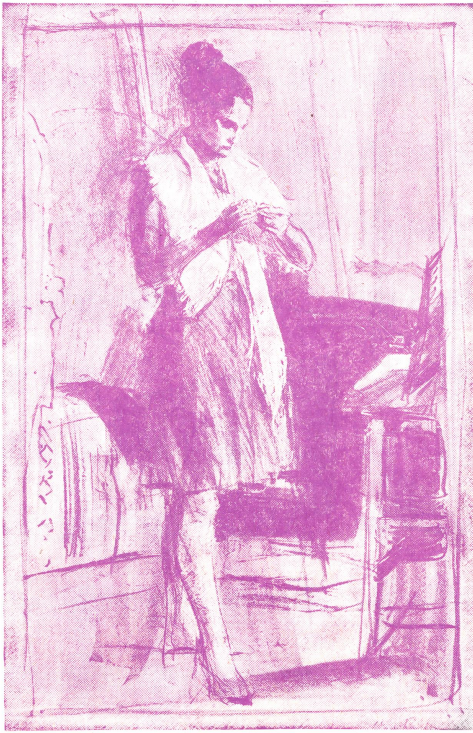
Radierung von Hans Falk