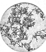
Vielleicht noch schädlicher sind diese spitzen Kristalle, die — wie Nadeln — die feinen Faserwände anstechen und aufrufen. Aufnahme durch das Mikroskop in ebenfalls 200facher Vergrößerung.