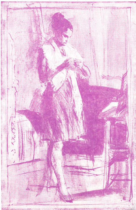
Radierung von Hans Falk