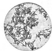
Vielleicht noch schädlicher sind diese spitzigen Kristalle, die - wie Nadeln - die feinen Faserwände anstechen und aufrufen. Aufnahme durch das Mikroskop in ebenfalls 200facher Vergrößerung.