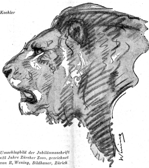
Umschlagbild der Jubiläumsschrift «25 Jahre Zürcher Zoos», gezeichnet von R. Wenig, Bildhauer, Zürich