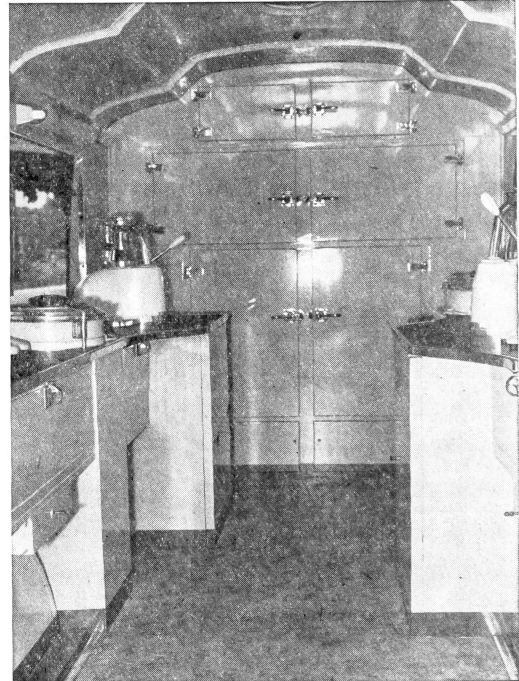
Eine moderne fahrbare Milchbar enthält alle notwendigen Einrichtungen für den hygienischen und ansprechenden Ausschank von Milch und Milchlischgetränken.