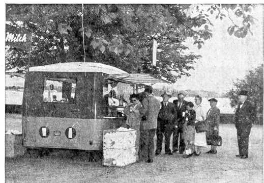
Die Stadt Zürich zeigt sich auch der Milchwerbung gegenüber aufgeschlossen, indem sie das Aufstellen der fahrenden Milchbar als Propagandastand am Mythenquai bewilligt hat.