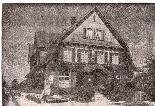
Wohnhaus und Bürogebäude