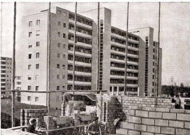
Auch der moderne Siedlungsbau bedient sich mit Vorteil des Backsteins. Er ist wertbeständig und gibt dem Architekten dank seiner Formenvielfalt reiche Gestaltungsfreiheit.

der Backstein über Jahrtausende hinweg bis in unsere Zeit das bevorzugte Baumaterial geblieben ist.