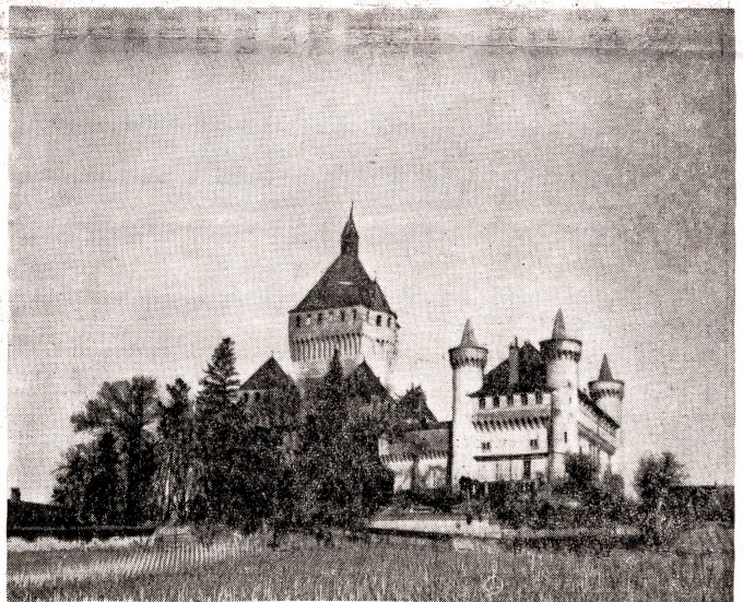
Das Schloß Vufflens ob Morges — in Backstein erbaut — ein prachtvoller Zeuge aus alter Zeit.

Forschung und Weiterentwicklung der Ziegeleiprodukte sind unter Mitarbeit namhafter Ingenieure und Architekten auf eine technisch-wissenschaftliche Grundlage gestellt worden. Eine verbandseigene Prüf- und Forschungsstelle ermöglicht die laufende Überprüfung der Erzeugnisse sowie die Abklärung der technischen Grundlagen für die praktische Anwendung der Ziegeleiprodukte. Die Technisierung hatte ferner zur Folge, daß die Ziegelindustrie der technischen Ausbildung vor allem der Betriebsleiter eine bedeutend größere Beachtung zu schenken begann, als das früher der Fall war.