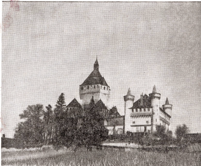
Das Schloß Vuiffens ob Morges — in Backstein erbaut — ein prachtvoller Zeuge aus alter Zeit.

ist kein Reklameslogan, es ist ganz einfach die Wirklichkeit, die sich immer wieder bestätigt findet.