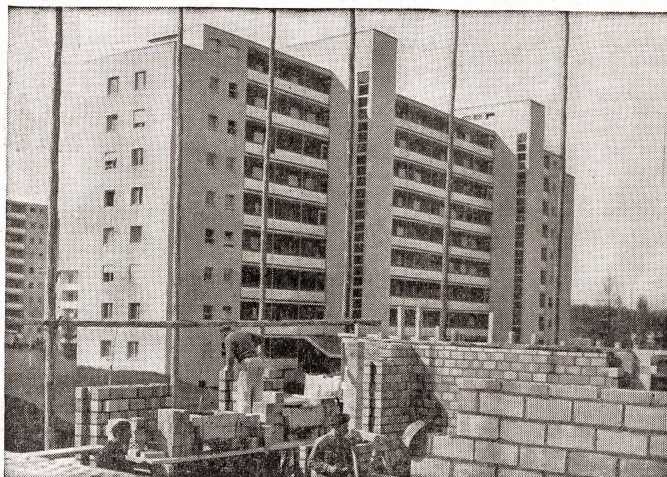
Auch der moderne Siedlungsbau bedient sich mit Vorteil des Backsteins. Er ist wertbeständig und gibt dem Architekten dank seiner Formenvielfalt reiche Gestaltungsfreiheit.