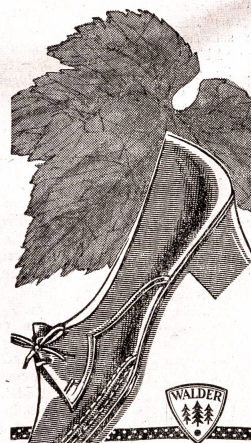
Ein besonders bequemer Trotteur mit dem beliebten 3/4 cm Absatz.