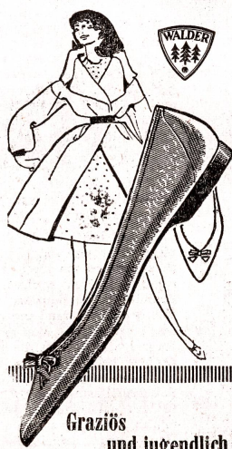
Graziös und jugendlich ist der neue Ballerina!